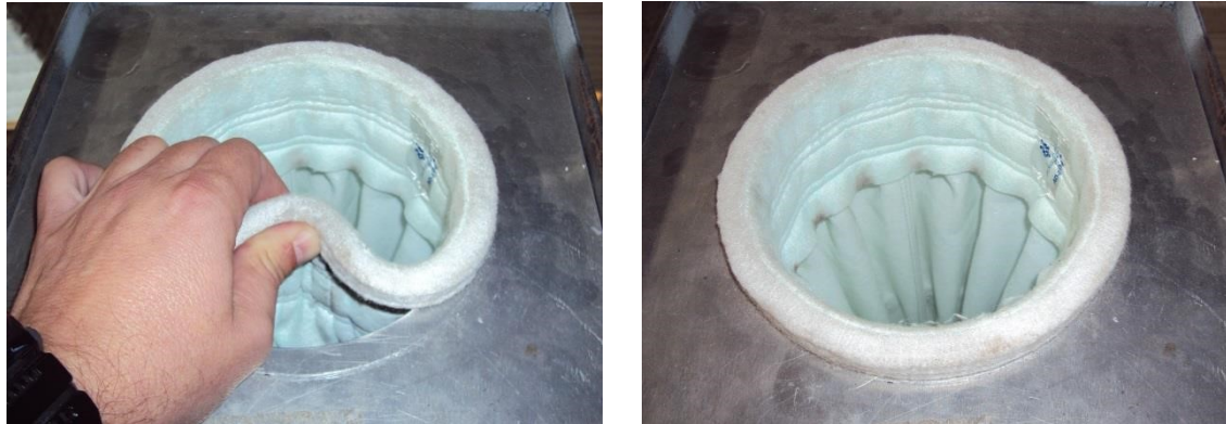
Figura 2. Manga encaixada na placa espelho.