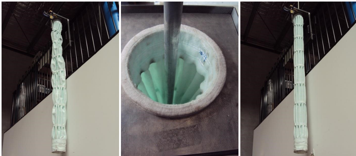
Figura 3: Uma pequena força aplicada na haste de instalação alinhara as plissas e deixará a manga pronta para a inserção da gaiola.