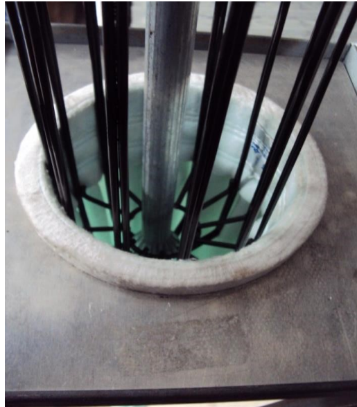
Figura 4: plissas alinhada com as longarinas da gaiola.