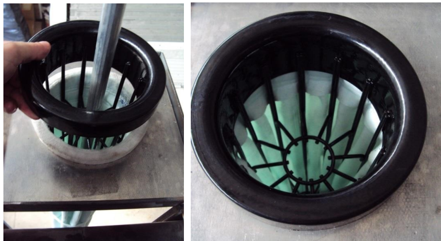
Figura 5: Final da instalação